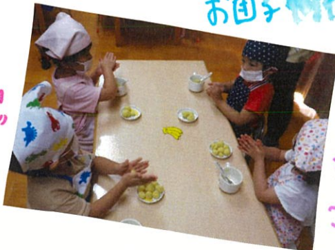
丸めるの 楽しいわ