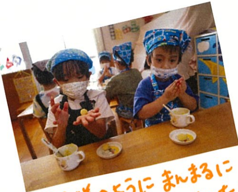
お月様のように まんまるに 丸めました!

3・4・5才児 お月見ホラト作りをしました♡ 材料は2つだけ! さつまいもとバニラアイス★三