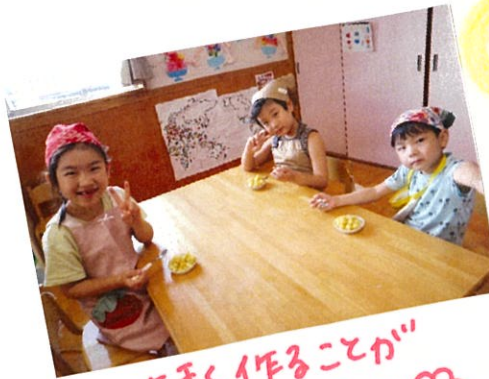
上手に作る事が できました🌸