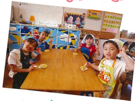
お団子何個できたかな??