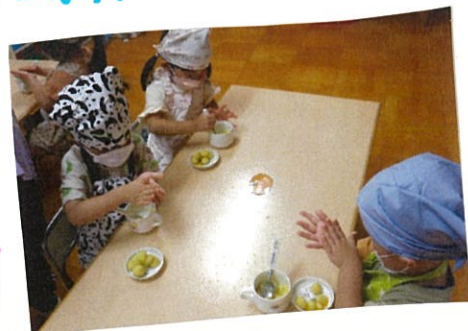
各クラス 楽しんで クッキングが できました