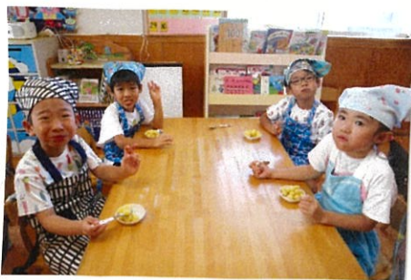
あまこ おいしいわ