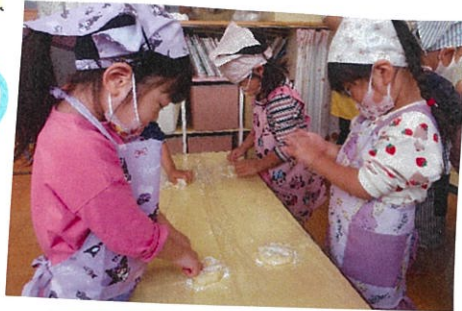
ふわふわにするわ!