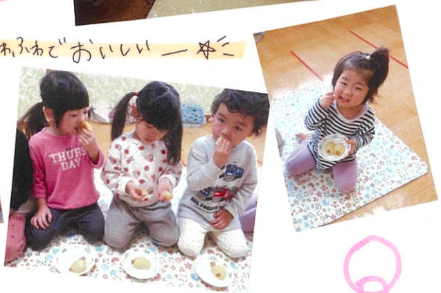
ふわふわでおいしいー★