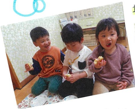
上手にできました♡