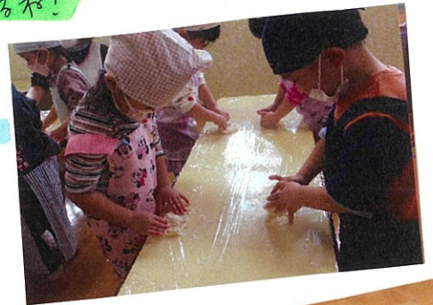
手に生地がひっつきよー